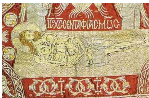
Monastero di Stavronikitva, dettaglio epitaphios

Sul monte Athos si conservano due epitafi del 1346 e del 1397 su cui sono ricamati quattro tropari degli enkòmia , chiamati anche thrènoi o epitafioi thrènoi , cioè lamentazioni o lamenti funebri. Purtroppo si ignorano gli autori, ma sono certamente molto antichi, probabilmente ispirati dai testi di Gregorio Nazianzeno (IV secolo) o di Romano il Melode (V-VI secolo).