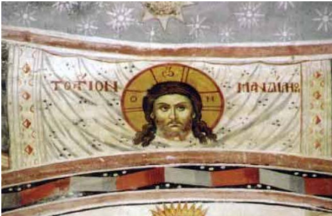
Mandyllion monastero di Docheiariou

I Padri della chiesa orientali e gli scrittori bizantini, poi, si sono certamente ispirati alla millenaria tradizione e alla vita liturgica delle chiese d'oriente, di cui fanno parte integrante sia le icone che le lipsana (reliquie) . Non ci si deve pertanto stupire se esiste una profonda relazione tra queste e il simbolismo di alcuni strumenti o momenti della liturgia nel rito bizantino. Cerimoniale che è considerato, soprattutto